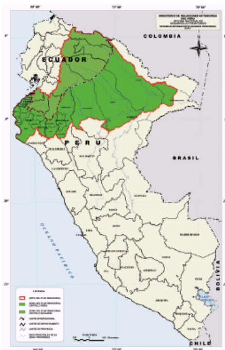
Figure 2: Bi-National Development Plan range

cantones de Ecuador. El Plan de Desarrollo Binacional provee un paraguas político para el diseño e implementación de infraestructura básica y proyectos de desarrollo social, conjuntamente con la protección y uso sustentable de los recursos naturales, preservando la identidad de los pueblos indígenas Jíbaros. Este Plan hace un reconocimiento especial de la selva húmeda de la Cordillera del Cóndor que mantiene el régimen de aguas de la región.